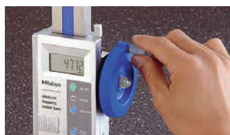
Vertikalförflyttning med ratt