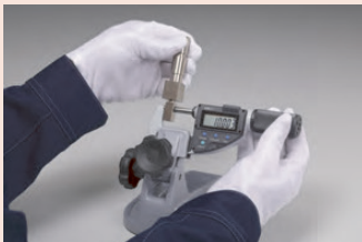
293-666-20 mikrometerhållare 156-101-10 (specialtillbehör)