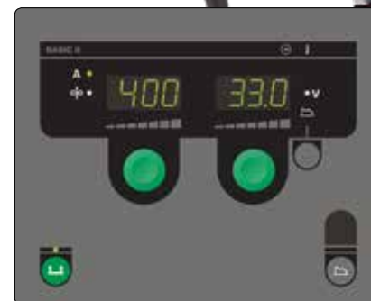
Basic panel till manuell inställning av svetsuppdrag

Omega har inbyggd kylning, som effektivt håller en låg driftstemperatur i brännaren oavsett belastning. Det innebär lång livslängd på slitdelar och problemfri trådmatning. Omega 550S levereras standard med dubbelkylning, och om man väljer Migatronics MIG-A Twist slangpaket av FKS-typen med dubbla kylkammare, säkras man maximal komfort under alla förhållanden.