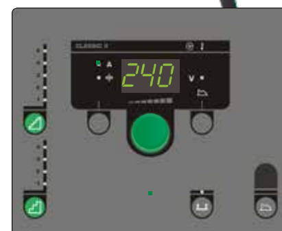
Classic panel till manuell betjäning av svetsmaskinen - med den steglösa inverters fördelar