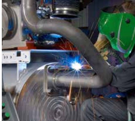
Svetsning i svart stål.