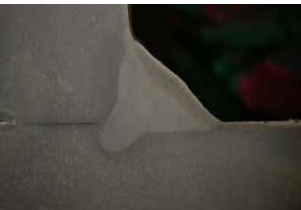
PowerArc säkrar djup inträngning vid kant- och stumpsöm och ökad svets hastighet i svart och rostfritt stål.