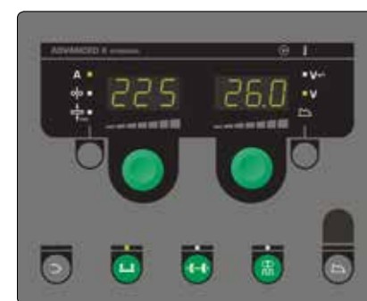
Advanced panel med bl.a. PowerArc och DUO Plus. DUO Plus ger TIG-liknande svets och ökad kontroll över smältbadet. Advanced panelen innehåller synergiska program till MIG lötning och svetsning med rör- eller massivtråd i svart och rostfritt stål och aluminium.