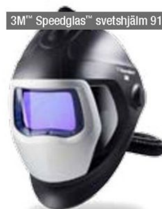
3M™ Speedglas™ svetshjälm 9100 Air