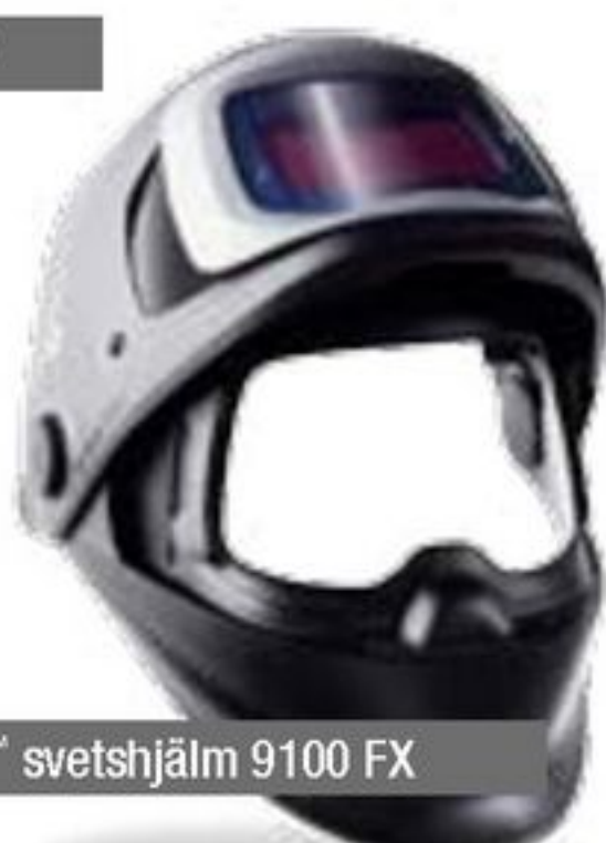
3M™ Speedglas™ svetshjälm 9100 FX