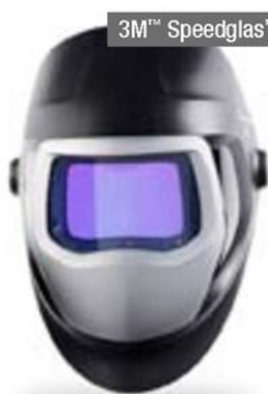
3M™ Speedglas™ svetshjälm 9100

När man redan har satt standarden för andra att följa, är innovation ett sätt att hålla ledningen. Alla våra svetshjälmarna och vår skyddsutrustning drar nytta av vårt engagemang för att ständigt utvecklas. Framtidens svetshjälm? Du håller den i dina händer.