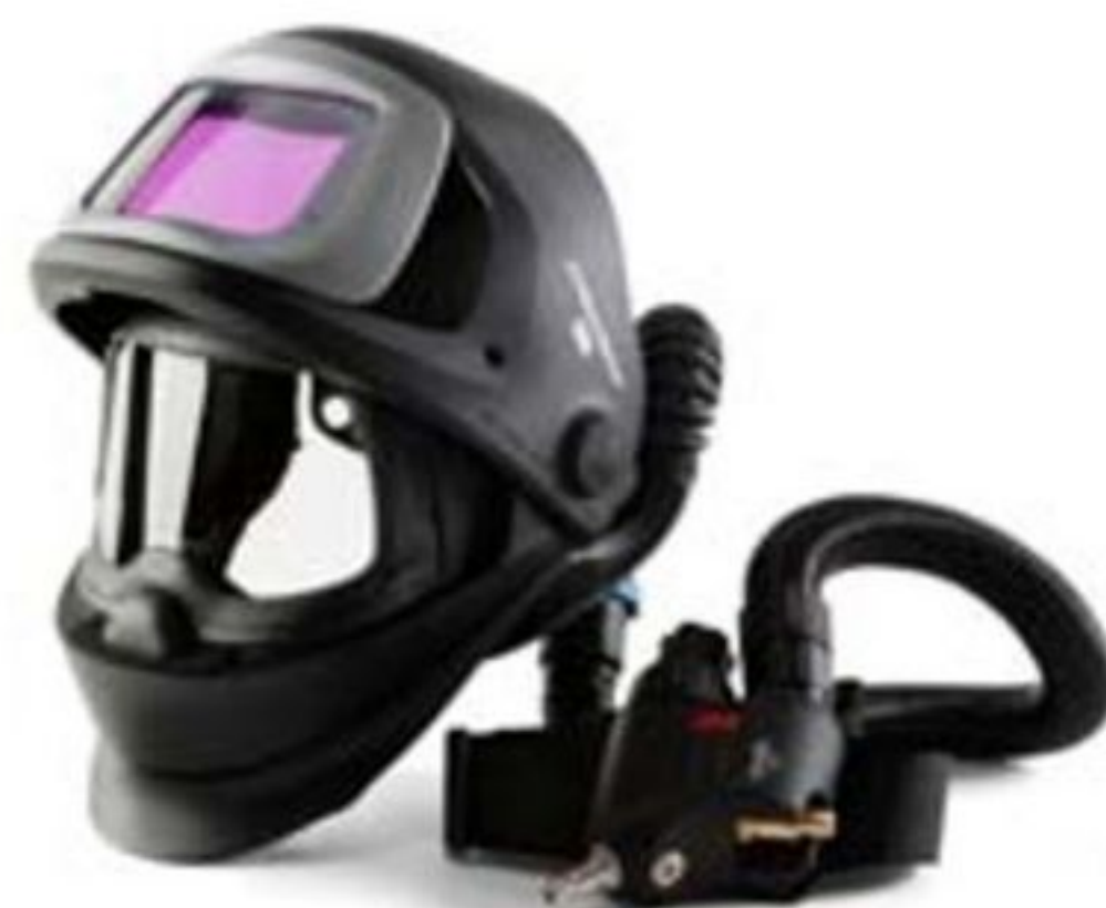
3M™ Speedglas™ svetshjälm 9100 FX Air

Kontakta din lokala 3M-återförsäljare för en demonstration.