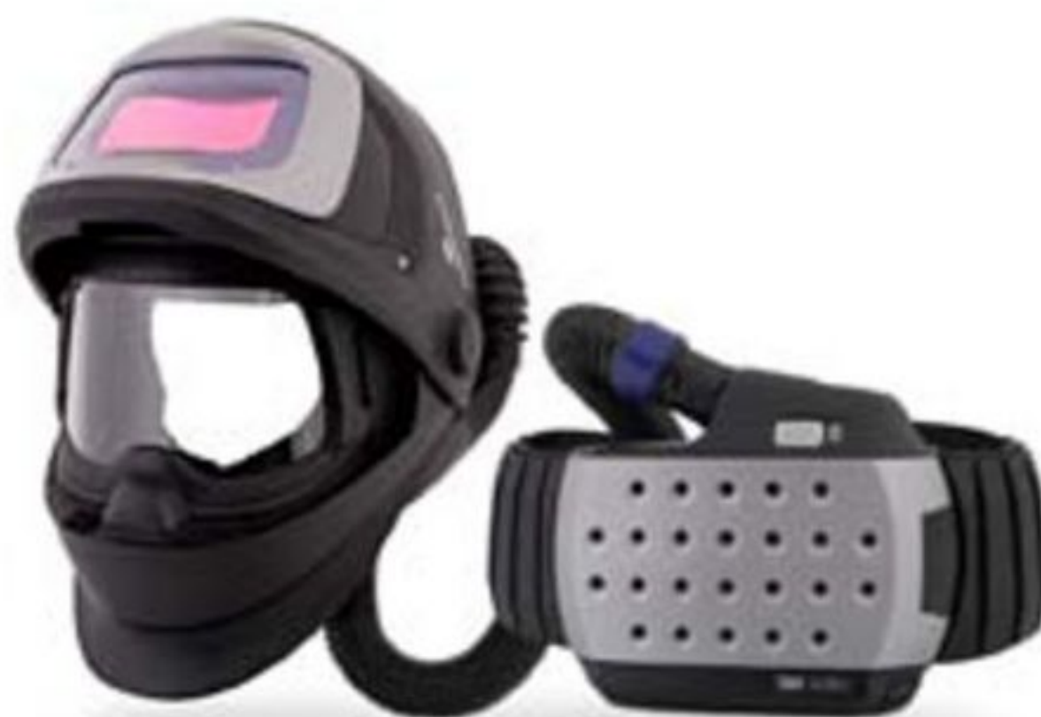
3M™ Speedglas™ svetshjälm 9100 FX Air

Vi har en passion för svetsning och vi känner till de utmaningar ditt yrke kräver. Det är naturligt för oss att dela den stolthet och omsorg du lägger i ditt arbete för att ta itu med de frågor om ergonomi och säkerhet som du ställs inför varje dag. Dina tankar och åsikter är av största vikt i vår ständiga sökan efter innovation. Inspirerad av din verklighet, formar vi framtidens svetsning så att du kan gå vidare med arbetet att forma vår.