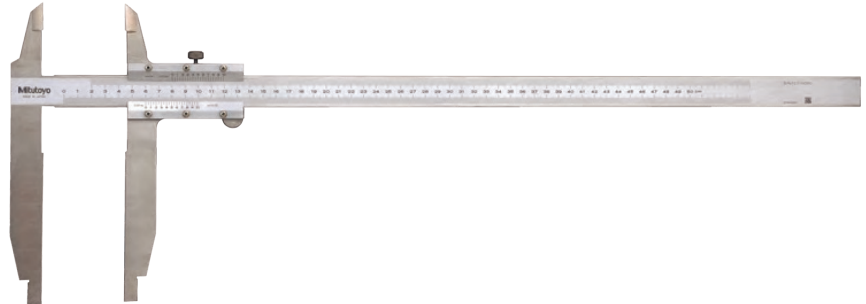
533-404 Utan finjustering