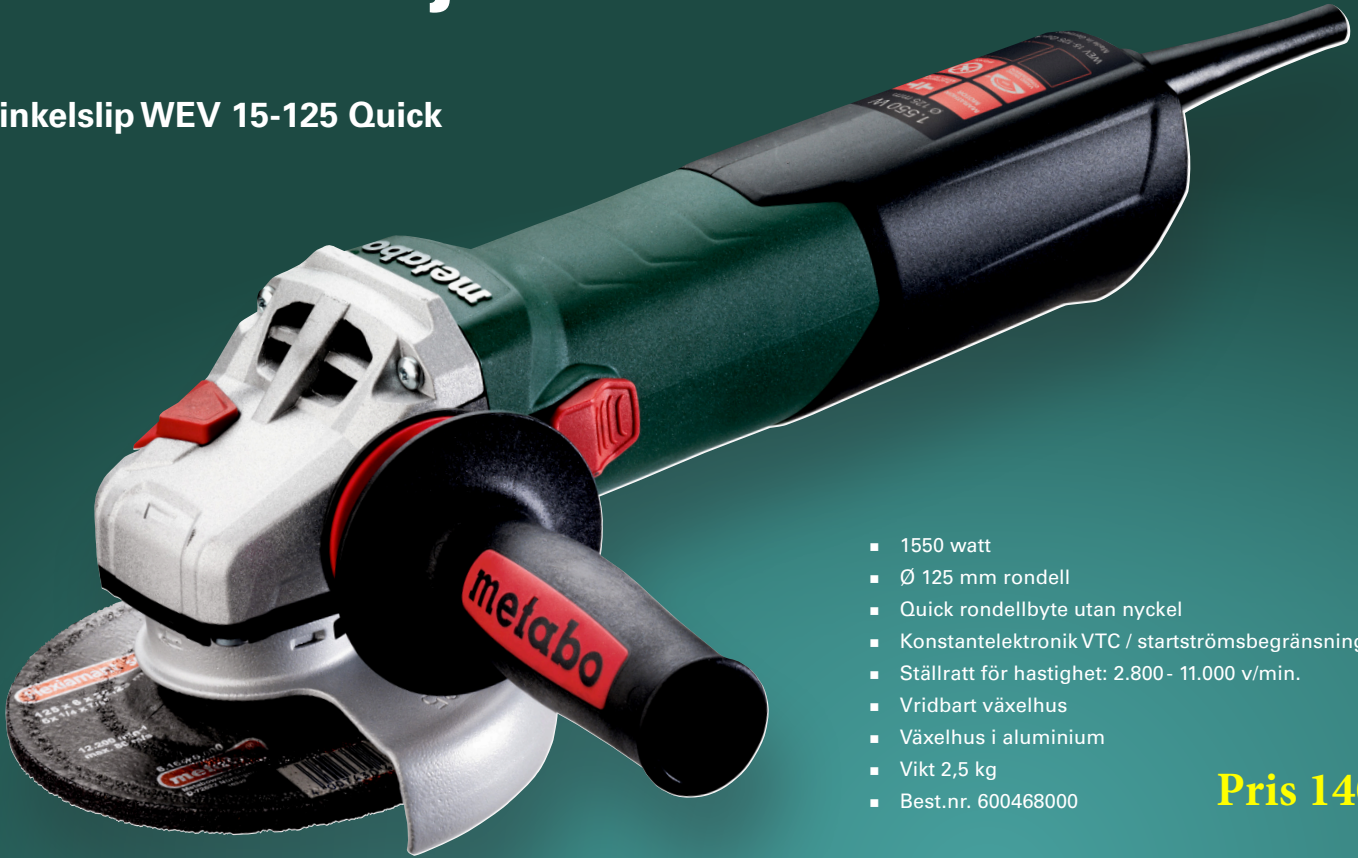
Vinkelslip WEV 15-125 Quick