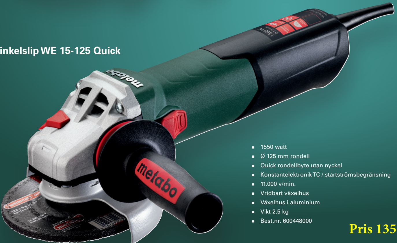
Vinkelslip WE 15-125 Quick