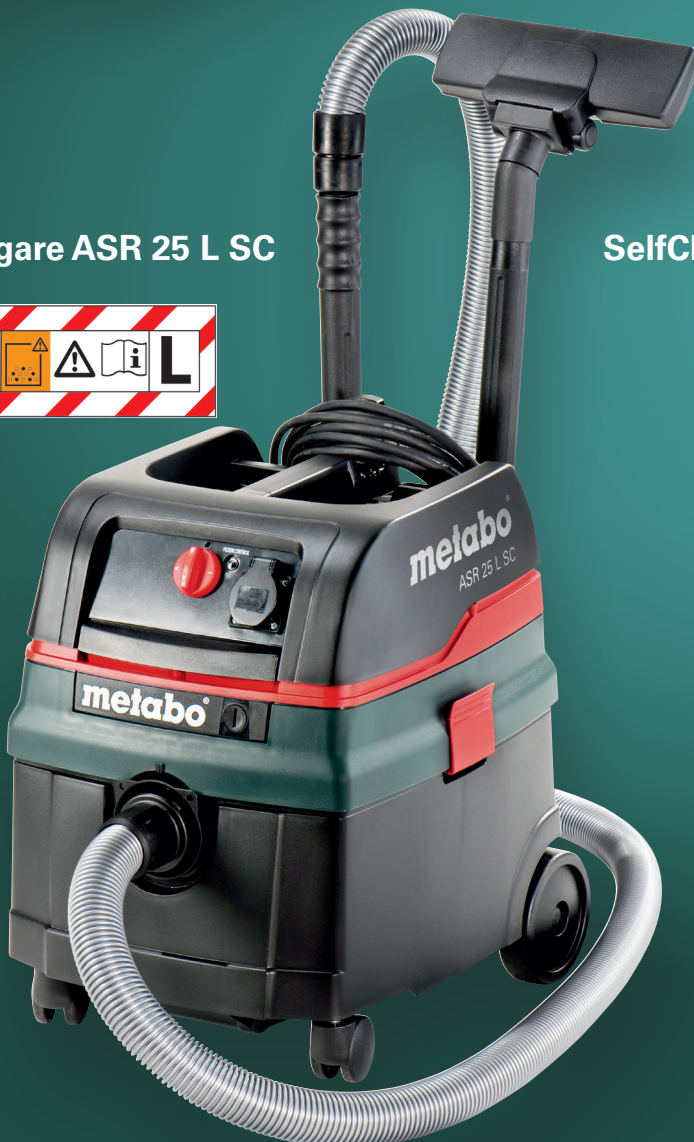
SelfClean: med elektromagnetisk avskakning och påslagsautomatik