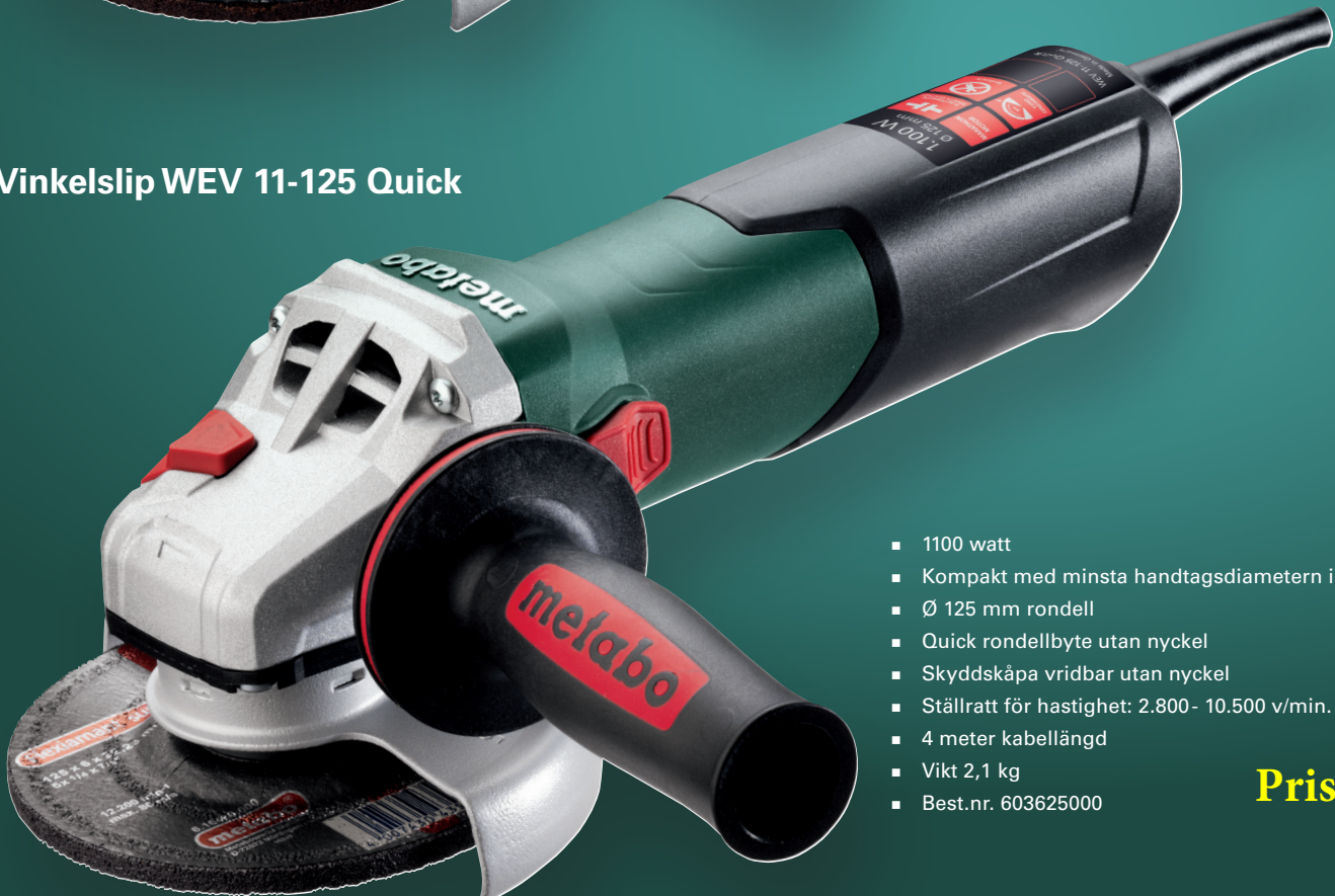
Vinkelslip WEV 11-125 Quick