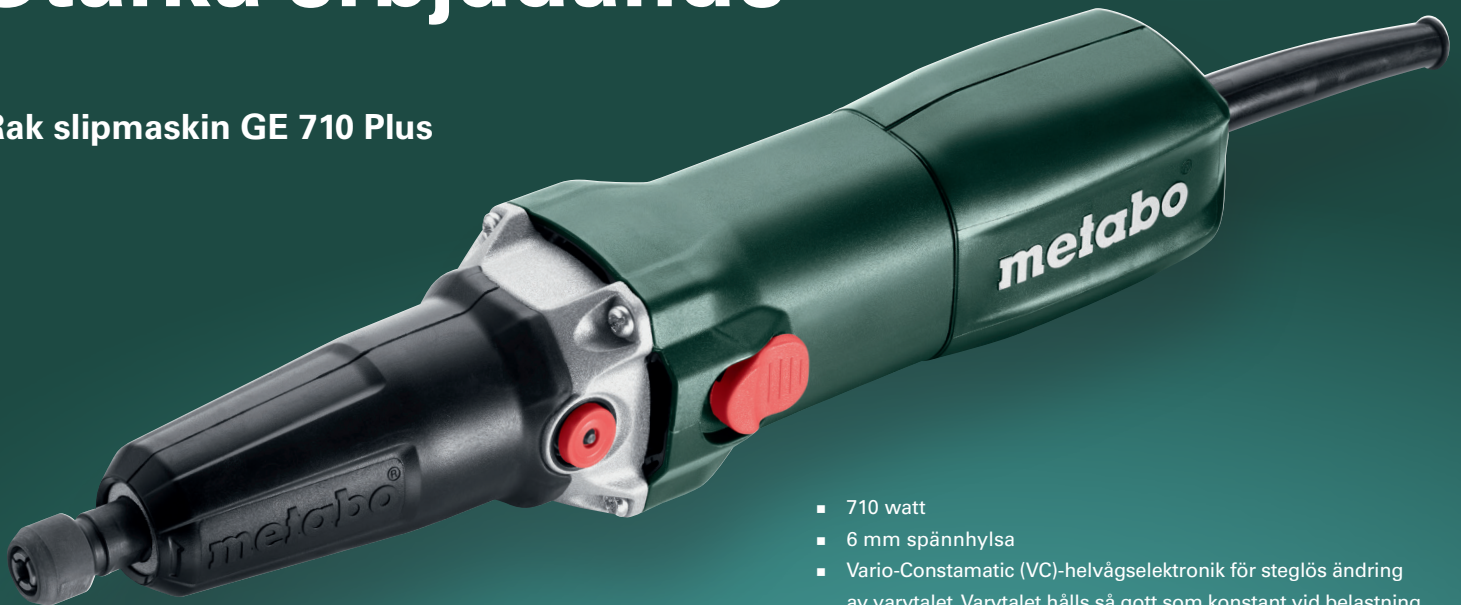
Rak slipmaskin GE 710 Plus