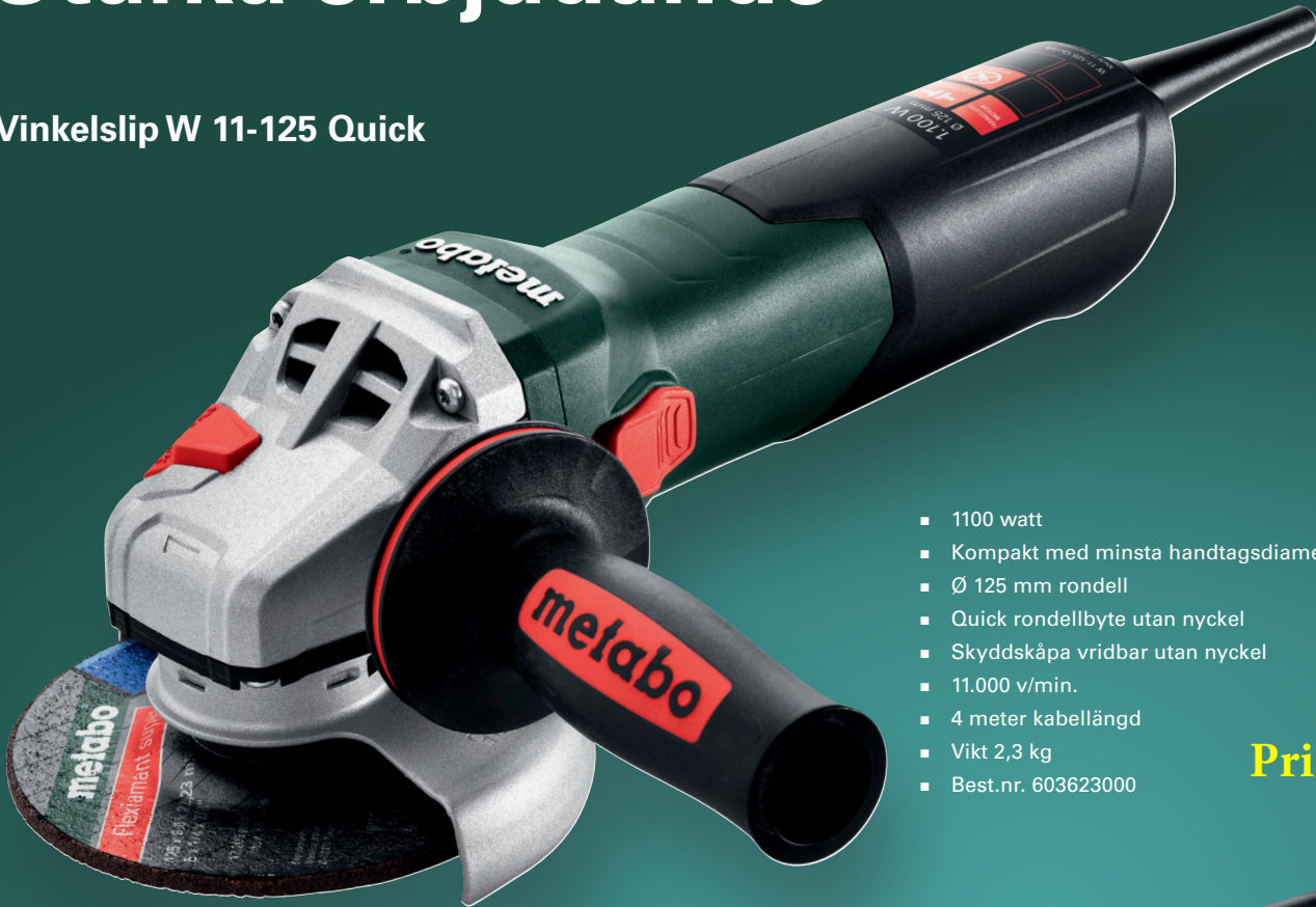
Vinkelslip W 11-125 Quick